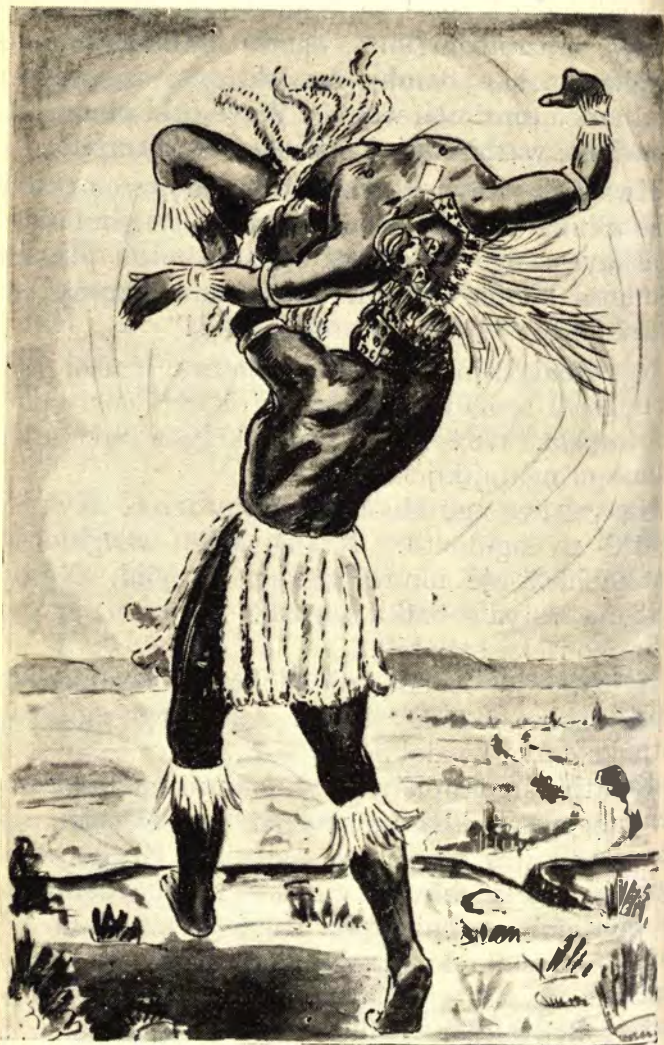
Ngamqukula ngamphakamisela phezulu ngamphonsa esiweni.

enzansi phansi esiweni. Ngasengibambelela kahle ngehla emthini, ngagaqa kahle ngewusa isiwa. Ngigaqa-nje, ngicabanga iNkosi ukuthi kazi iyakukujafulela ukungibona ngisaphila na.