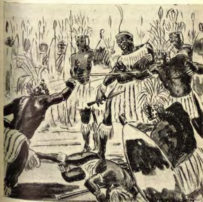
Umkhonto wangena kimi esicutshini sengalo wathi buxe .

UMaviyo waphenduka wabeka iNkosi. Wo! Angaze ngalithanda leliya liso, lalibi kwangathi kukhona asekuqondile, ngasengithi ukusondela eNkosini, sengima eduze impela. Kanti bala,