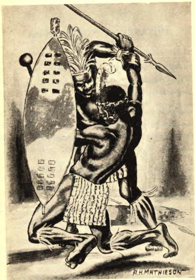
Suka lapha lomfokazana! Kanginduna yeNkosi yini!