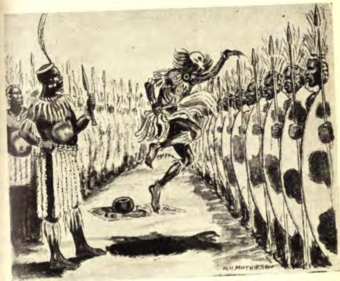
Isangoma saxhuma saya phezulu, saye semaphambi kwebutho.

Zehla impela izinyembezi kulomfo manje, samuzwa esebifitheka njengengane. Wo! sambona isangoma. Samgqolozela njalo ngeso. Wo! Wakhamuluka manje esekhala.