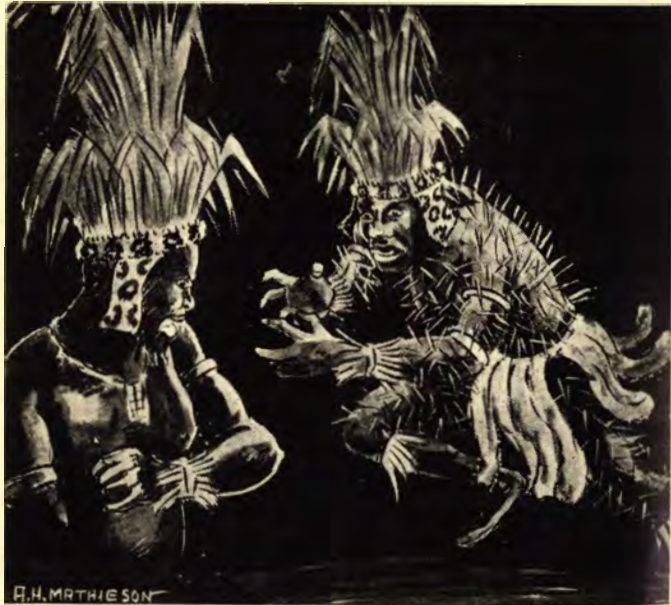
Lapho ngasengigaxe umhluhlwe wonke umzimba, sengifana nengungum bane.

gi gi . Ngezwa kuwa igabade liphonseka emgodini khona phakathi. Ngabona ukuthi sekunguye uMavakeni. Ngathula ngathi sumpu, ngaphefumulela phakathi, ngathi ukuhosheka, ngema. Kwathi nya, nya, nya , ngezwa sengidinwa manje ukuthi kakusale sekubakanye kanti.