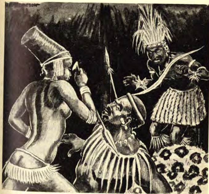
Uthinike manje Tshinga-ndini!

Sithe sisathule, sibeke lokho, yaxhuma into mbazana yaxhumisa okohlanya, yayisiwufakile umkhonto—iwufaka kuyo lapha ezingazini—yaze yazigwaza amanxeba amathathu.