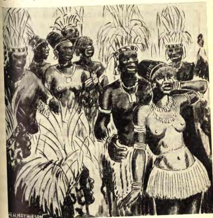
Kwathi kusa lwalufika udwendwe lwami luvela koNqabayembu.

khe uNomusa. Wafika umukhwe wami bakhuluma neNkosi. Nami ngangikhona iNkosi ikhuluma naye, ngoba ifike yamtshela ukuthi isifuna ukuba umntwana aphume kusasa, yathi amabutho isiwa-bizile, yayisimyala ithi kuhle ukuba ayiyale ingane yakhe ize ibenokuhlonipha ngoba nakhu yendela isikhulu seNkosi, izokwatha umuzi weNkosi. Awu! kwaamnandi ukukhuluma kweNkosi kumukhwe wami, naye wabonga njalo eNkosini, e-de engithi jeqe, emoyizela nami ngimoyizele.