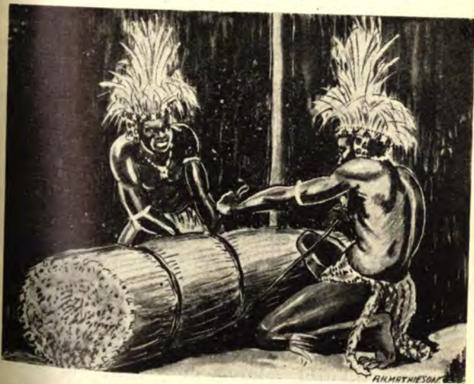
Kuhle sikubophise sikuthi ngqi.

laba abafokazana - bo, nanginsinya kangaka!" Bathi: "Oha Nkosi, siyeke sikunsinye kakhulu, yikhona ungekubidlika."